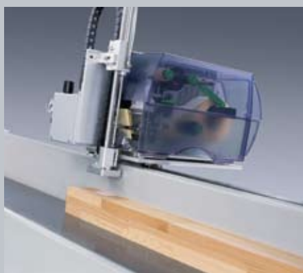
OPTICUT S90 Magas teljesítmény, rugalmasság és egyszerű kezelés

GREENTEAM Iparfejlesztő és Kereskedelmi Kft. Tel.: 94/510-830. www.greenteamkft.hu